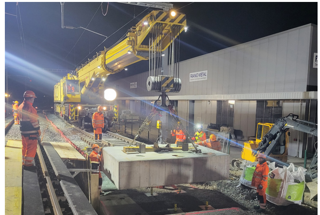
Mise en place des appuis pour les ponts provisoires