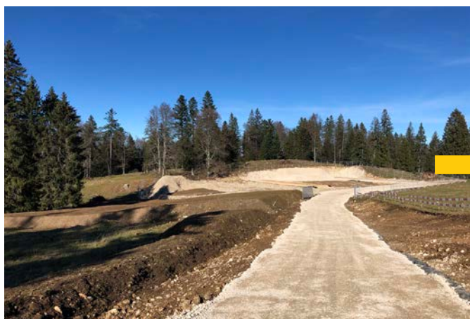
Plateforme lors des travaux