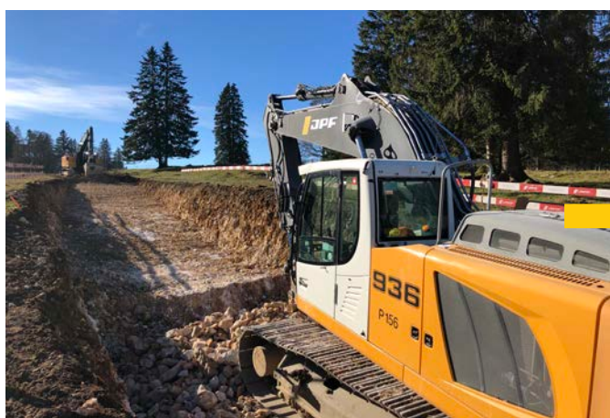
Route d'accès lors des travaux