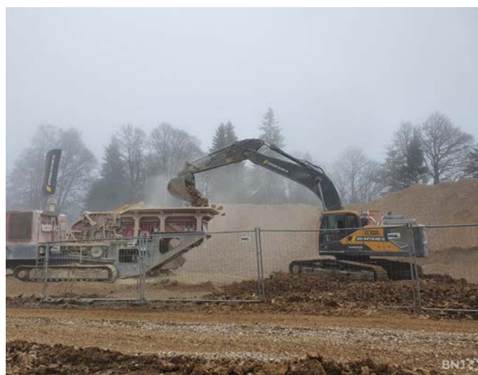
Concassage des matériaux sur place