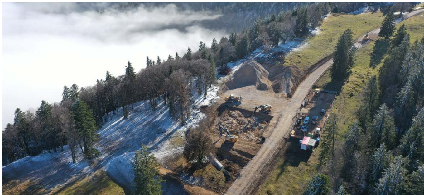
Plateforme lors des travaux