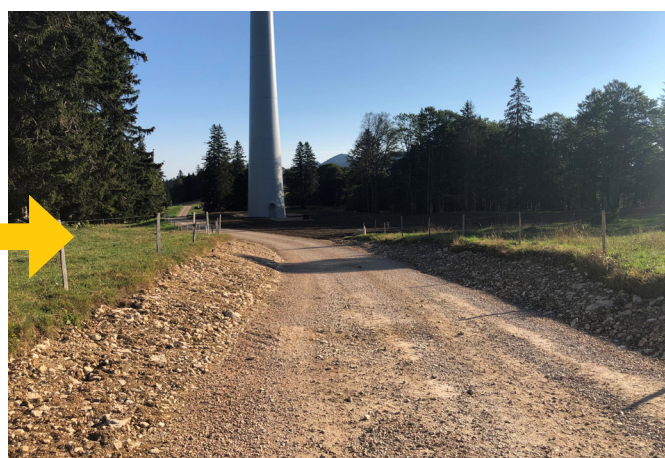
Route d'accès aménagée après les travaux