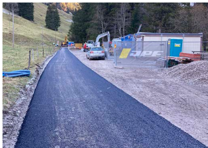
▲ Secteur Eau Froide ▲