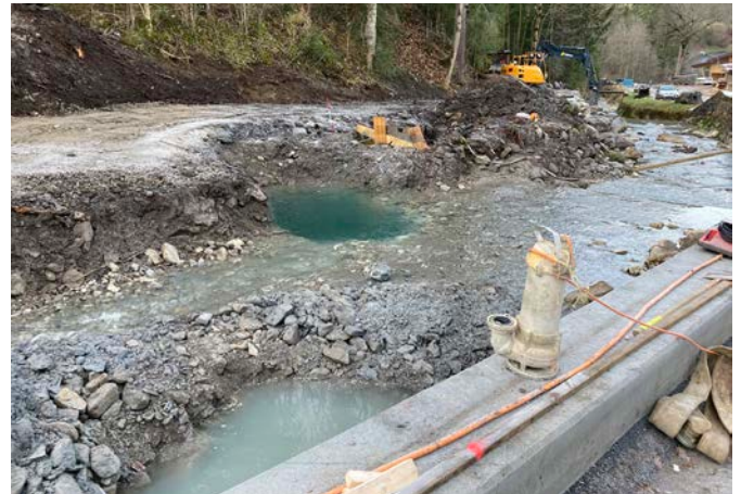
▲ Déviation provisoire ruisseau (secteur Torneresse) ▲