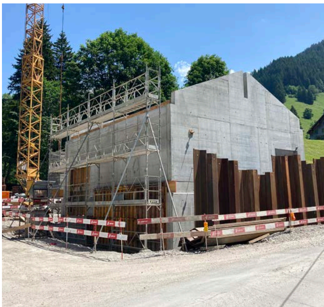
Station de turbinage en béton armé