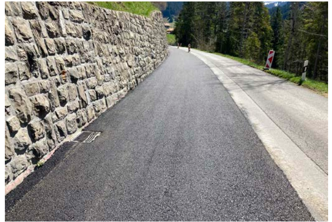
▲ Secteur Les Bornels ▲